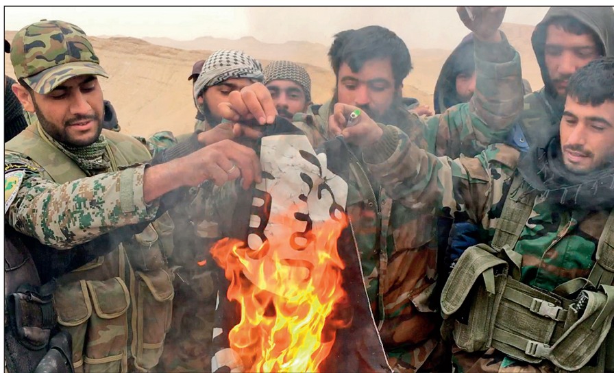
Народные ополченцы САР сжигают флаг ИГИЛ, снятый с отбитой у боевиков цитадели Пальмира.

Современное государство обязано защищать интересы каждого своего гражданина вне зависимости от его расы, национальности, принадлежности к определенной конфессии или религиозной традиции, в то время как ИГИЛ выражает интересы небольшой группы религиозных радикалов, жестоко подавляя остальную часть населения посредством запугивания, насилия и террора.