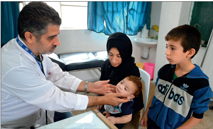
Истинный ислам призывает к состраданию и милосердию. Врач осматривает ребенка в медицинском пункте лагеря при одной из школ Дамаска.

Радикалы объявляют «врагами ислама» всех несогласных с ними мусульман. Ультрарадикальные группировки признают террор и насилие единственным способом достижения провозглашенных ими целей.